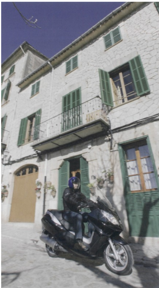
Kleine Gassen und Straßenzüge? Kein Problem.

merken. Laut Peugeot wird dieser Umstand bei der Auslieferung der Fahrzeuge behoben sein. Der Satelis ist somit auch für längere Strecken gerüstet. Selbst zwei Personen mit einem Gewicht von je 80 Kg sind kein Problem, man bewegt sich flott voran. Geschwindigkeiten von 115 km/h und mehr sollten dem Fahrzeug keine Probleme bereiten. Verarbeitung und Gesamteindruck des Franzosen sind Top. Jedoch ist unser erster Eindruck, dass sich die Spezialisten von Peugeot zu sehr an den Piaggio X8 angelehnt haben. Heckpartie und Lenkung sehen dem Italiener zum Verwechseln ähnlich.