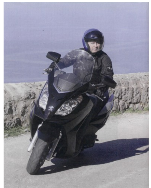
Das Erscheinungsbild wirkt erwachsen und rund.

Fahren lässt sich der Satelis wunderbar. Selbst kleine Kurven sind für den großen Roller kein Problem. Wendig und flott meisterte der Franzose die engen Gassen in Palma. Auf den kurzen Autobahnstrecken bewies das Fahrzeug einen guten Geradeauslauf. Das Windschild leistet gute Arbeit. Denn es gab keine Nennenswerte Windprobleme. Peugeot möchte das Windschild jedoch noch etwas verbessern. Die Rückspiegel ließen sich gut justieren. Der Blick nach hinten war OK. Blinker und Schalter repräsentieren den aktuellen gehobenen Standard. Beim Armaturenbrett jedoch kommt das verspielte hervor. Wunderschön wie Drehzahlmesser, Tacho, Tankuhr, Temperatur in einem sanften rot verpackt wurden.