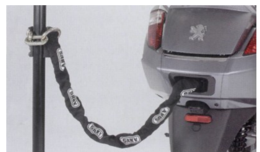
Alles an Bord. Das Panzerschloss im Executive ist eine feine Lösung.