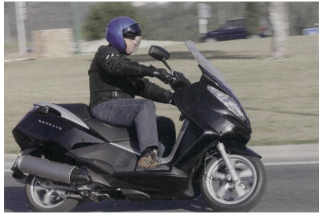
Überzeugend. Der Kofferraum macht Laune auf Reisen.