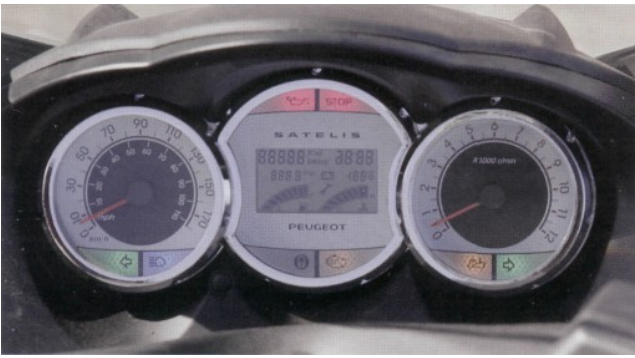
Das Armaturenbrett ist ein Gedicht. Übersichtlich mit tollen Funktionen.